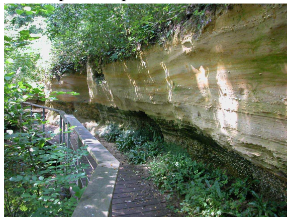
Réserve géologique de Saucats