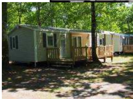
Camping Domaine de la Forge La Teste-de-Buch