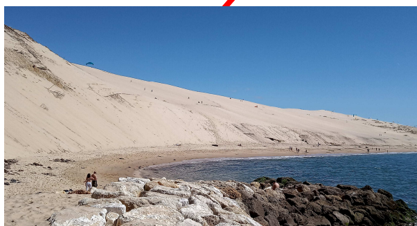
La Dune du Pyla