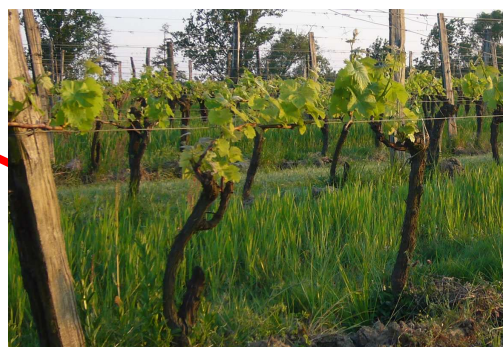
Géologie et vins de Bordeaux