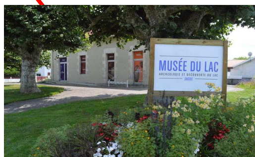
Musée d'archéologie Sublacustre du Lac de Sanguinet